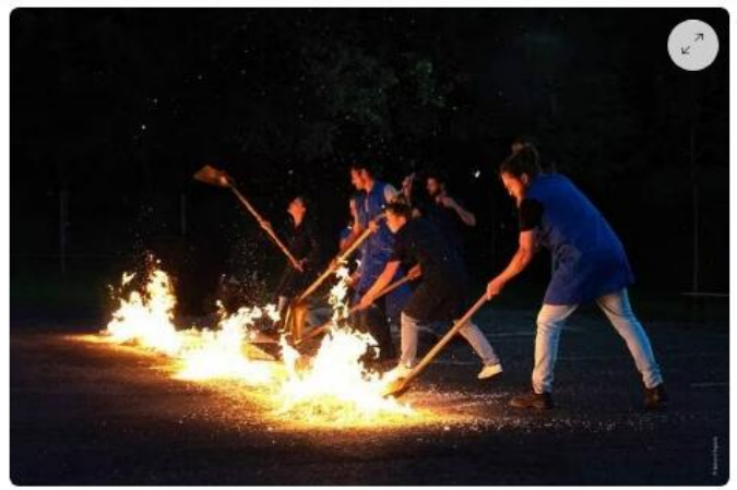
Le feu est l'une des composantes de ce spectacle en plein air donné sur l'esplanade du quai de Rohan à Lorient.