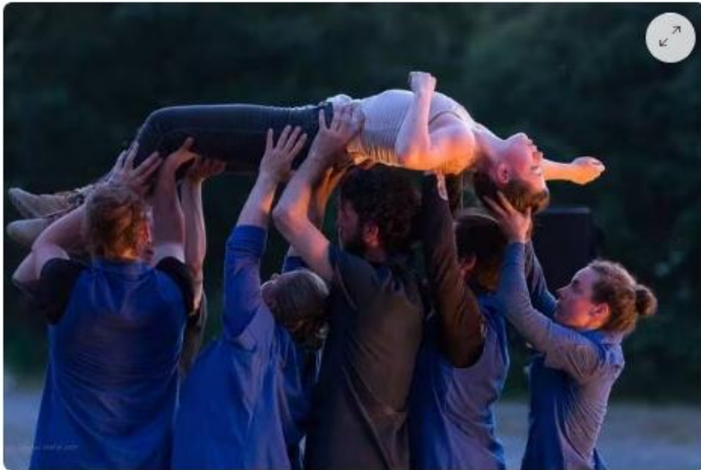
« Rouge feu », ce sont six danseurs et une comédienne sur une bande-son nourrie de témoignages d'ouvriers des pays de Lorient et Quimperlé.

« La base de ce spectacle a été créé en 2019, détaille la chorégraphe. et ne cesse de se transformer au fil des représentations, comme nous avons déjà pu le faire à Réservoir Danse , à Rennes en 2022 ».