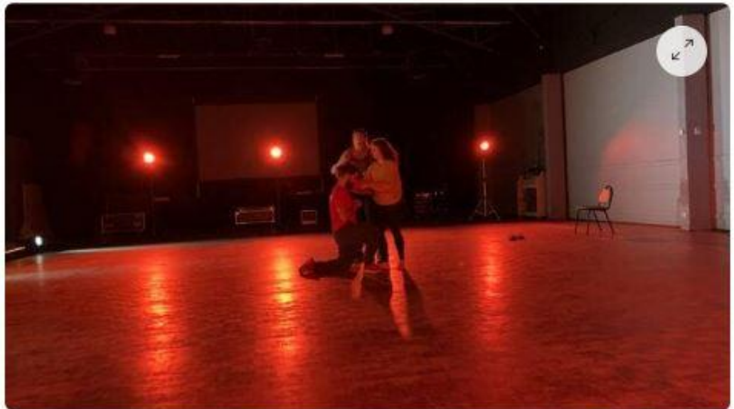
La compagnie Y a un trou dans l'mur, en résidence à l'espace Benoîte-Groult.