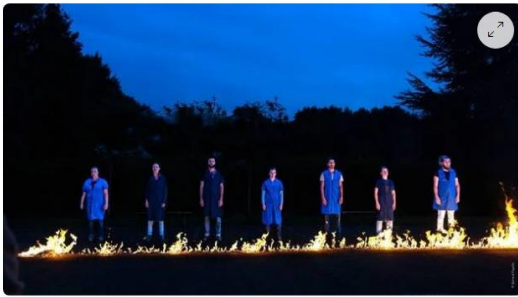
La création « Rouge feu » met en scène la vie ouvrière et industrielle dans une chorégraphie originale de la compagnie Y'a Un Trou Dans L'Mur.

Quest-France Pierre WADOUX. Publié le 21/05/2024 à 10h05